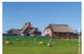
Einmal per Kutsche ‚über Rungholt fahren‘. Kutschfahrten zur Vogelschutz-Hallig Südfall im Sommerhalbjahr täglich (oben).

Die unendliche Weite, die friedliche und ruhige Landschaft und die frische Nordseeluft genießen – das ist Erholung pur! Wir laden Sie ein, unsere einmalige Natur zu bestaunen und per Schiff die nordfriesische Insel- und Halligwelt zu besuchen. Die Wunder des Weltnaturerbes Wattenmeer lassen sich hier bei uns aktiv zu Fuß bei einer Wattwanderung oder mit der Pferdekutsche erkunden. Ein Teil des längsten Fahrradweges der Welt (6.000 km), der North-Sea-Cycle-Route, führt über Nordstrand und lässt das Radfahrer-Herz höher schlagen.