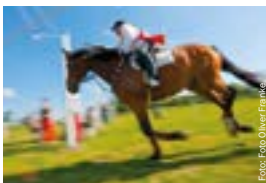
Ringreiten in der Husumer Bucht.

Im Herbst dreht sich alles um die leckeren Nordsee-Krabben, im Winter locken der Weihnachtsmarkt und die Husumer Eiseitz. Und wenn die Nordfriesen beim Biike-Brennen das Ende der kalten Jahreszeit feiern, naht bereits die Krokusblüte.