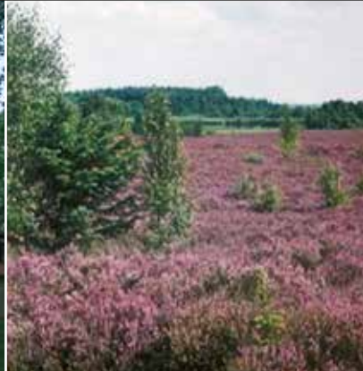
Bordelumer und Langenhorner Heide