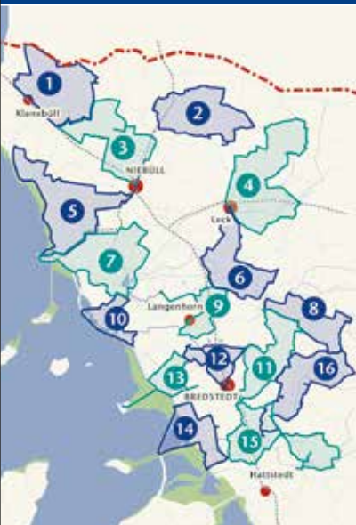
»Westermöhl« in Langenhorn