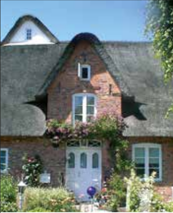
Reetdachhaus in Bargum