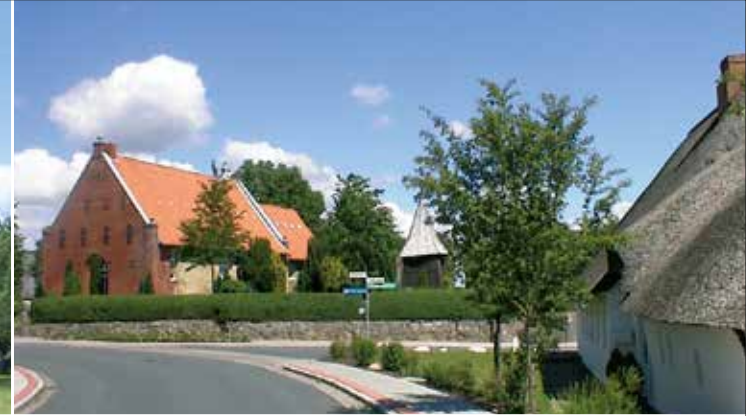
Historischer Dorfkern mit Kirche in Bargum