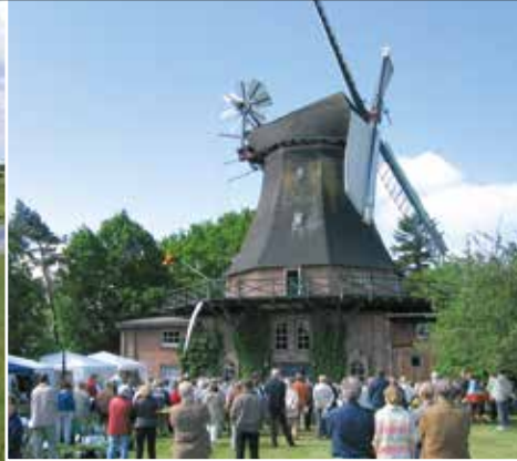
»Aeolus« in Bargum