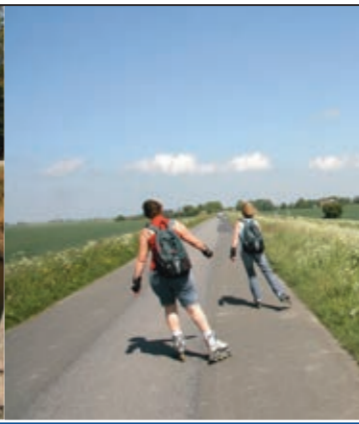
...auch eine schöne »Inlinertour«