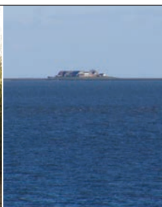
Hallig im Wattenmeer