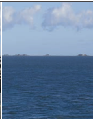
Halligen im Wattenmeer