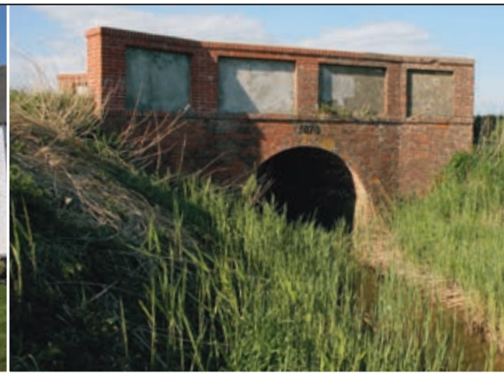
Hundertjährige Brücke im Christian-Albrechts-Koog