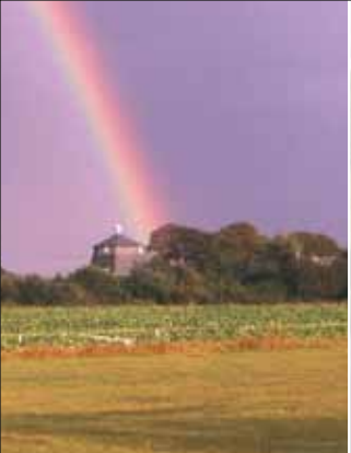
Petersburger Mühle in Drelsdorf