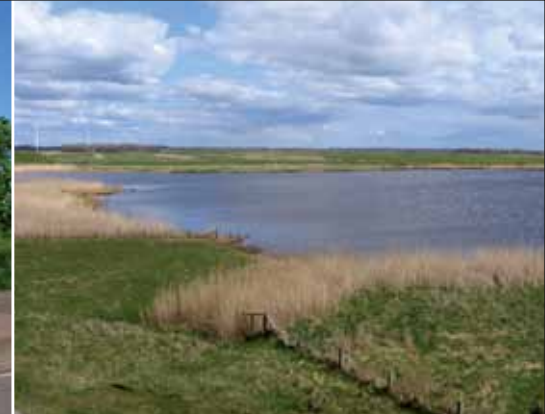
Die 'Große Wehle' am Deich der Hattstedter Marsch