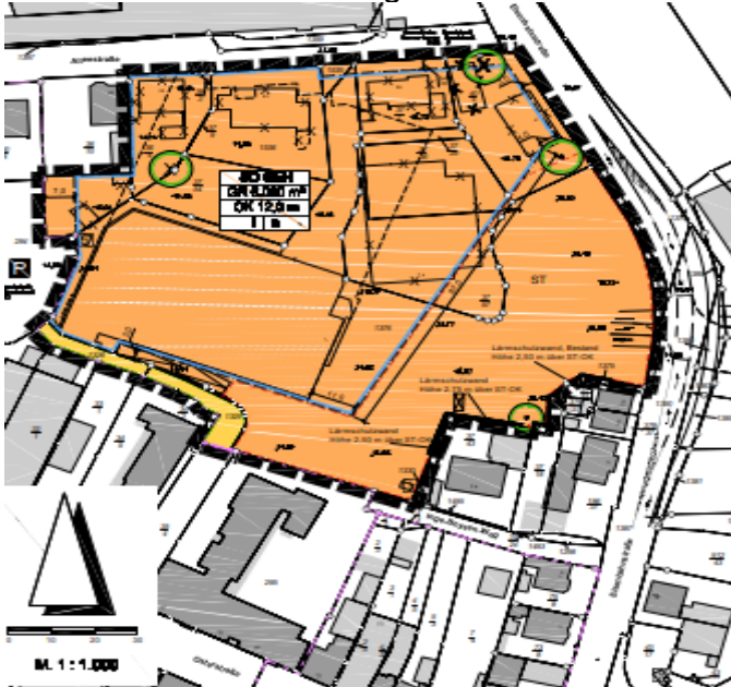
Entwurf 1. Änderung B-Plan Nr. 28